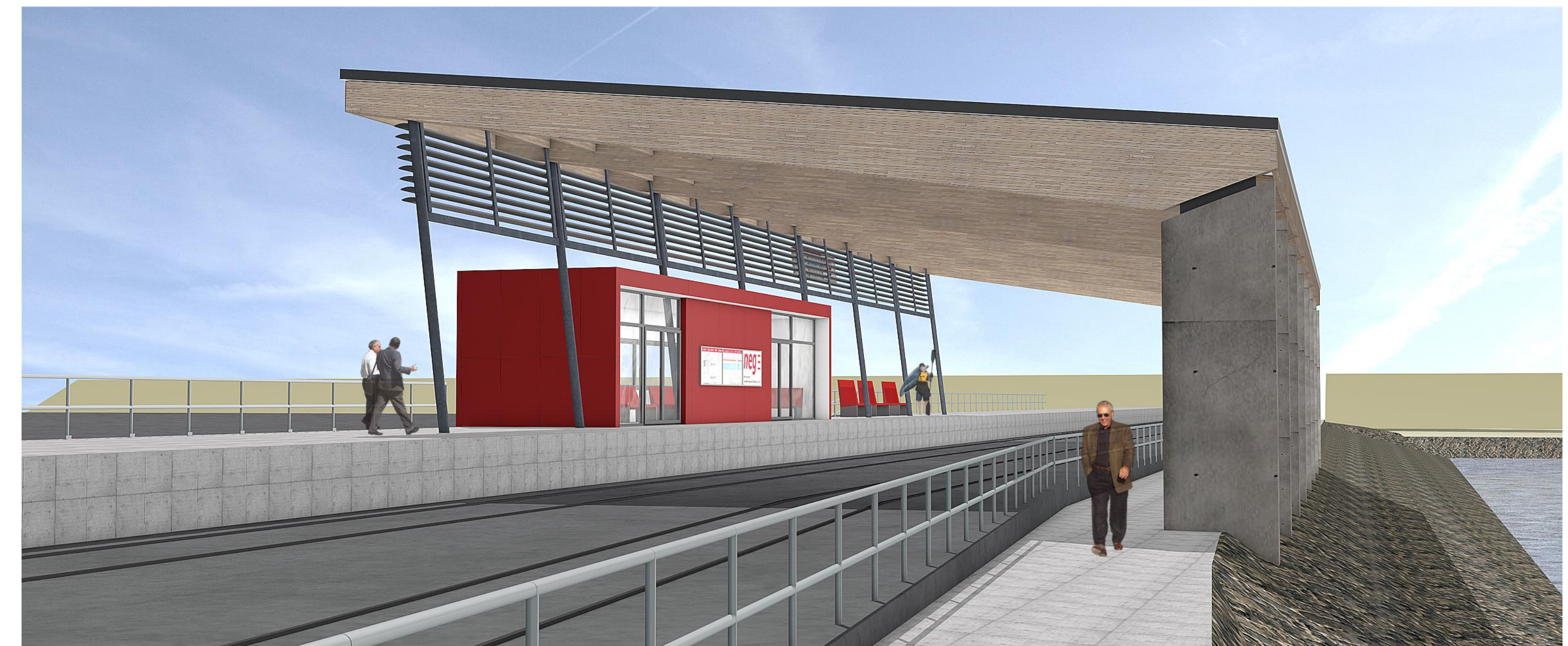
Perspektive 2 (West, Blickrichtung Dagebüll)