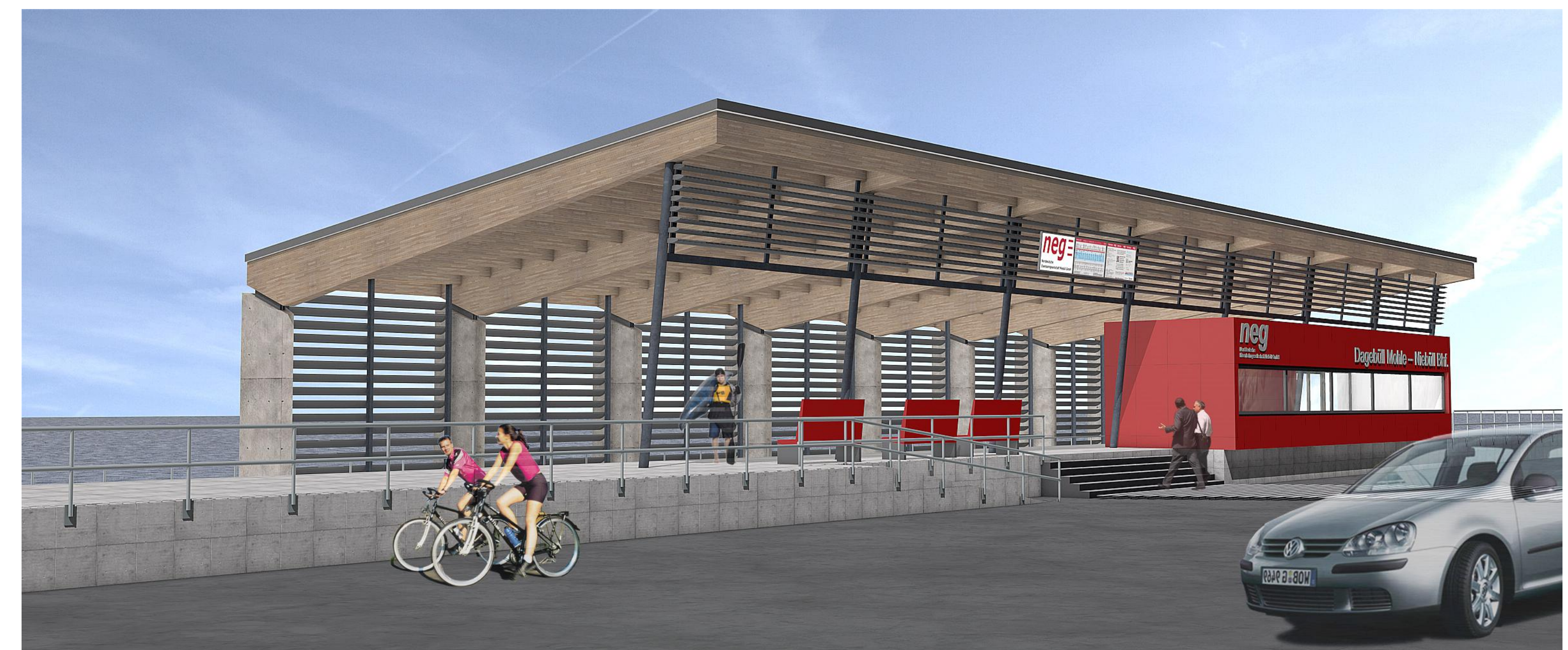
Perspektive 1 (Nord-Ost, Blickrichtung Föhr)