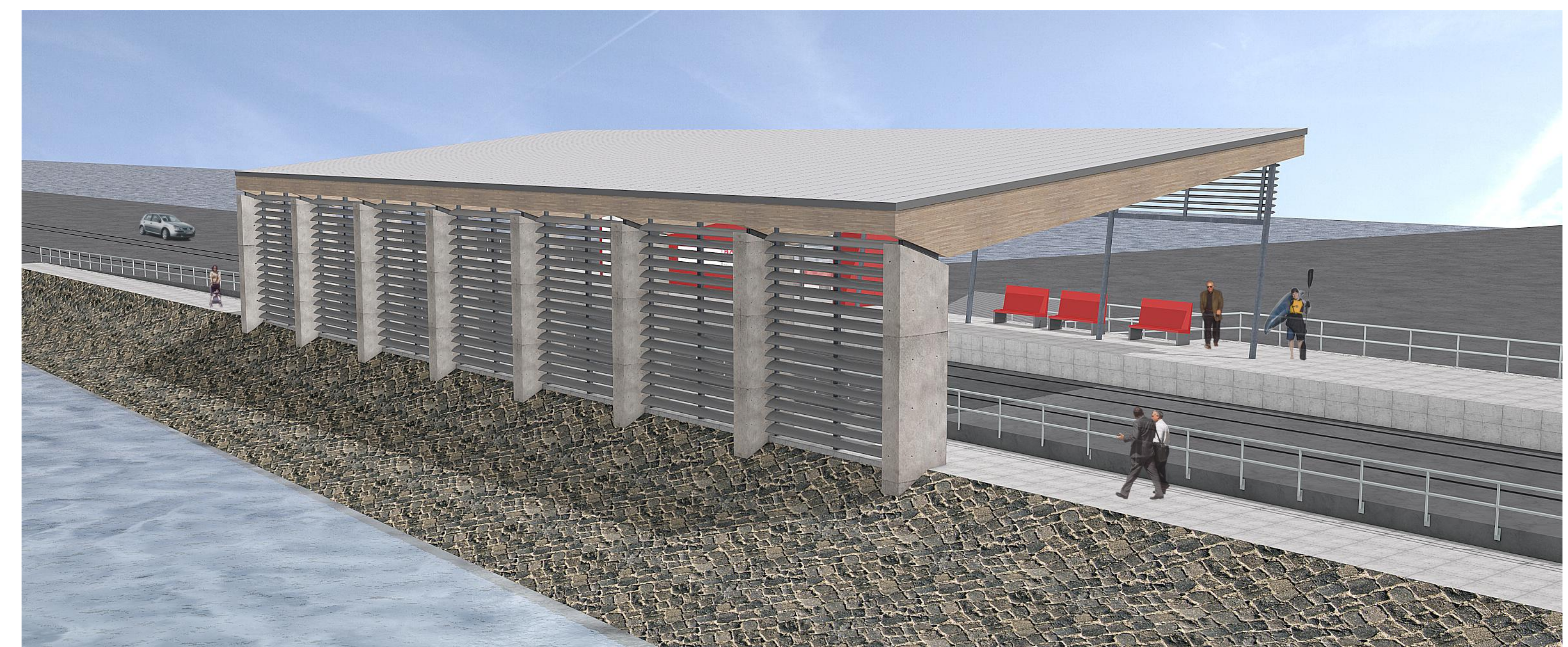
Perspektive 3 (Süd-Ost, Blickrichtung "Tor zu den Inseln")